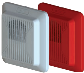
Altavoz Para Pared