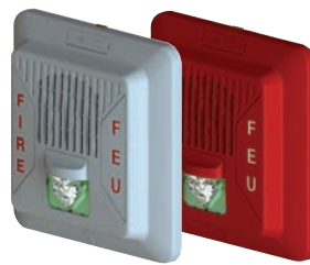
Altavoz Con Estrobo Para Pared