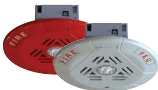
Haut-parleurs/stroboscopes de plafond