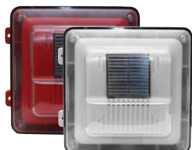
Haut-parleur mural/plafond protégé contre les intempéries