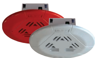
Haut-parleurs de plafond