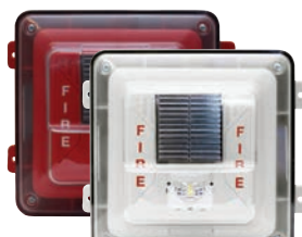
Haut-parleur/stroboscope mural protégé contre les intempéries