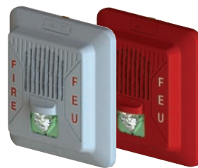
Haut-parleurs stroboscopes muraux