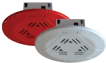
Haut-parleurs de plafond