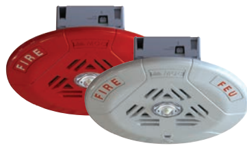
Haut-parleurs stroboscopes de plafond