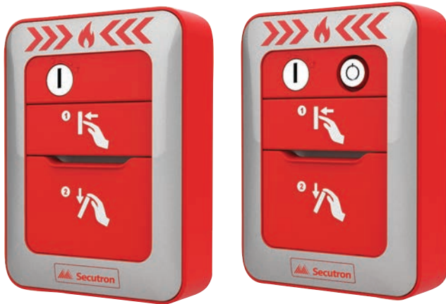
MRM-810MP(U) Una Etapa