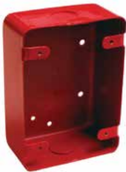
RM-700 Caja de montaje superficial Caja posterior

Dimensiones: 5" Alto x 3.6" Ancho x 2.0" Profundidad