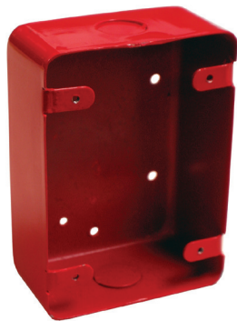
MRM-700 Caja posterior de montaje en superficie

Dimensiones: 5" Alto x 3.6" Ancho x 2.0" Profundidad