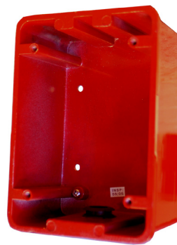
MRM-700WP Caja posterior de montaje en superficie resistente a la intemperie

Dimensiones: 5" Alto x 3.6" Ancho x 2.0" Profundidad