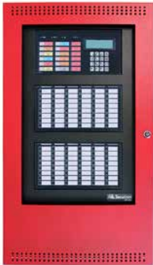
El panel MR-401R está mostrado con dos módulos opcionales RAX-1048TZDS